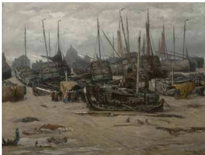
H.W. Mesdag (1831-1915) Na de Storm van 1894 , 1896 Olieverf op doek, 138 x 178 cm, Collectie Panorama Mesdag

Ook aan die lange, warme en droge zomer kwam een einde, we gaan al aardig richting winter. Maar bij de herfst hoort eerst nog storm. De gevroese najaarsstormen zijn door veel schilders op doek gezet. In Panorama Mesdag is daar een tentoonstelling van gemaakt, die te zien is van 18 november tot 3 maart. Het gaat om schilderijen uit de negentiende eeuw, en dat die in Panorama Mesdag zijn te zien, is niet toevallig. Mesdag schilderde veel strandtaferelen op Scheveningen, een pittoresk kunstenaarsdorp, waar onder anderen ook Josef Israels en Jacob Maris veel hebben gewerkt.